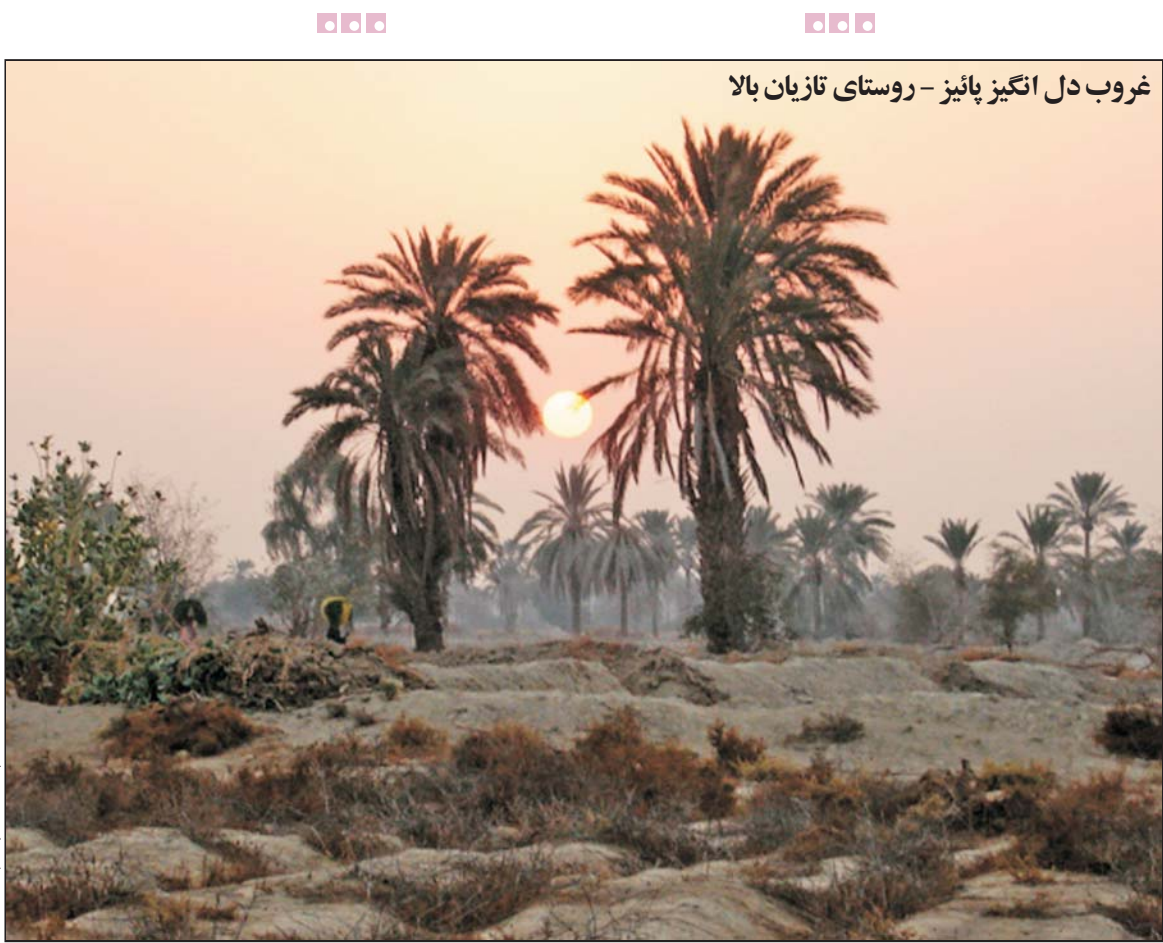
غروب دل انگیز پائیز - روستای تازیان بالا